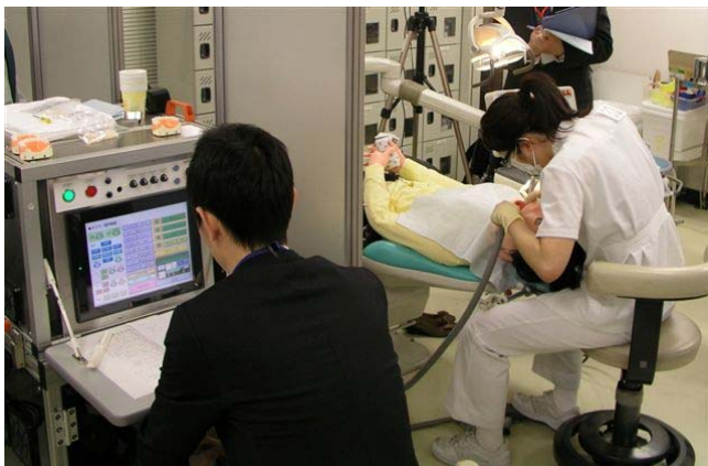
患者型ロボットで窩洞形成を行う受験者

実施にあたって香港大学, アデレード大学より専門家を招聘し, 外部評価を受けました. 広い領域をまたぐ複合的な内容を評価する方法であることから試験(examination)ではなくintegrated OSCA (integrated Objective Structured Clinical Assessment)と呼称するのがふさわしいとの提言をいただきました.