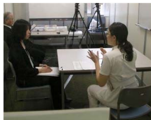
模擬患者に医療面接を行う受験者

内容はA: 診察, B: 医療面接, C: 診療計画立案, D: 臨床技能の4ブロックで, 11課題としました. 臨床実習前の共用試験OSCEに比較して, 知識の統合とそれに立脚した診療能力, 参加型実習を通して身に付くべきコミュニケーション能力, 治療計画立案能力, 治療経過にそった臨床判断能力等を評価しました. 動画を利用した患者観察や, 患者型ロボット(オペレーターがパネル操作をすることで患者同様の応答をする)の応用などは今後さらなる発展が期待される課題となりました. 技術, 知識の評価だけではなく, プロとしての態度やコミュニケーション等, 従来の方法では評価しにくかった部分も明確にでき, 最終日には若干名の学生に対して総合的な再指導も行いました.