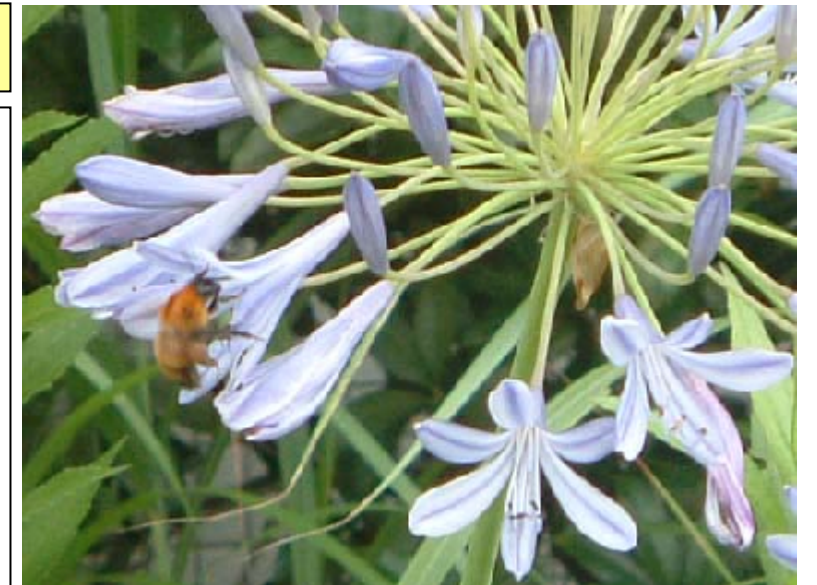
ムラサキクンシランと蜂