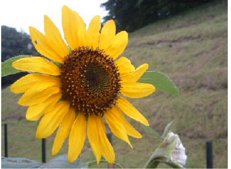
ひまわり(最近少なくなっと思いませんか?) 8/1 市内某所にて

巻頭言 「ドラえもんによろしく」?? どもセンター長・教授 板橋 家頭夫 イベント情報 「七夕まつり」 4B(小児)病棟 患者様へのお知らせ・お願い 病院機能評価について 公開講座の開催予定のお知らせ 医師の配属・異動・退職 診療統計 北部病院の理念 外来担当表 患者様からのご意見・ご要望 (アンケート時のご意見・ご要望)