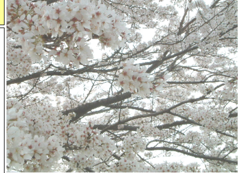
5 回目の桜の季節を迎えました。